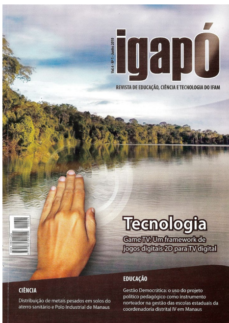
Figura 1: Capa da Revista Igapó

A inserção de fotografias e gráficos deve seguir os mesmos procedimentos aplicados à figura. Os contornos dos gráficos deverão ser legíveis para um perfeito entendimento das informações contidas neles e correta correlação com texto (Figura 2).