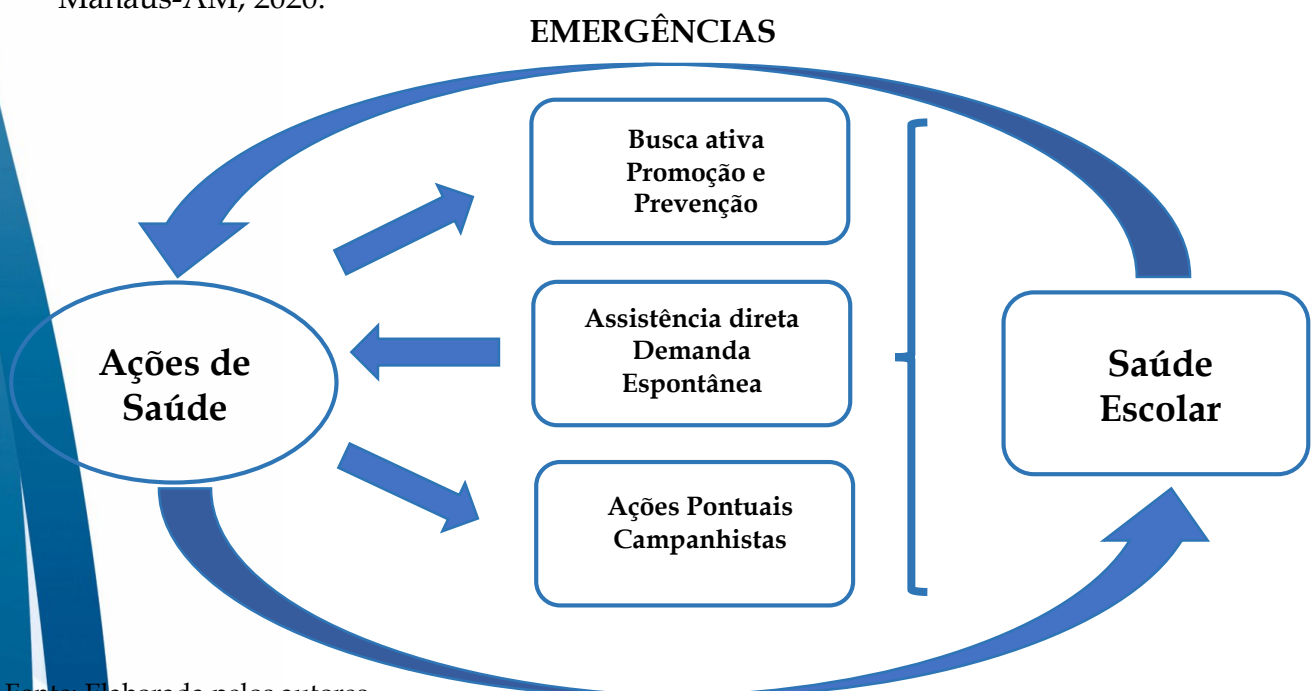
Figura 1- Modelo Teórico Conceitual referente às demandas de ações em saúde escolar. Manaus-AM, 2020.

O interesse pela temática originou-se do modelo teórico conceitual (Figura 1) elaborado pelos autores onde foi levantado o questionamento acerca das atividades assistenciais desenvolvidas no âmbito escolar, estas implementadas por equipe multiprofissional, quanto a demanda para o desenvolvimento de ações de saúde.