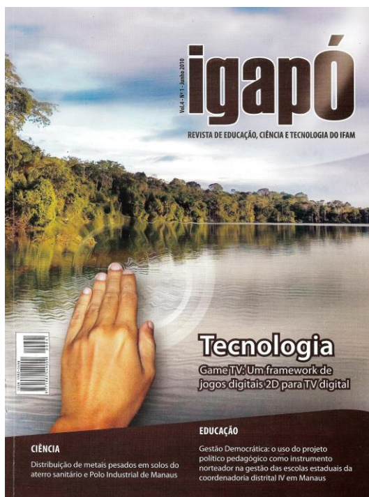
Figura 1: Capa da Revista Igapó

É importante o autor saber que a Revista Igapó é impressa e o tamanho mínimo de qualquer imagem, gráfico, fotografia ou ilustração deve ser de, no mínimo, 225 dpi. O artigo será devolvido para o autor se, na prova final da gráfica, as imagens apresentarem defeito na impressão devido a baixa resolução, pois tal ato compromete a qualidade da publicação. Abaixo, exemplo de uma imagem com resolução em 300 dpi.