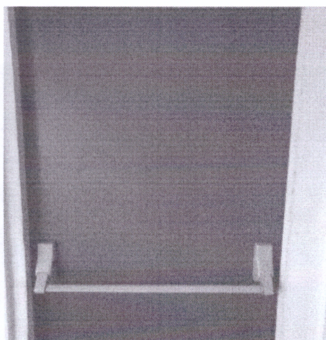
Figura 2 - única saída de emergência da edificação

Os locais de trabalho deverão dispor de saídas, em número suficiente e dispostas de modo que aqueles que se encontrem nesses locais possam abandoná-los com rapidez e segurança, em caso de emergência.