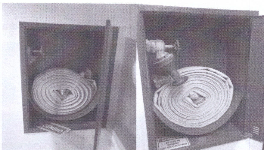
Figura 1 - placas de sinalização subutilizadas

As aberturas, saídas e vias de passagem devem ser claramente assinaladas por meio de placas ou sinais luminosos, indicando a direção da saída.