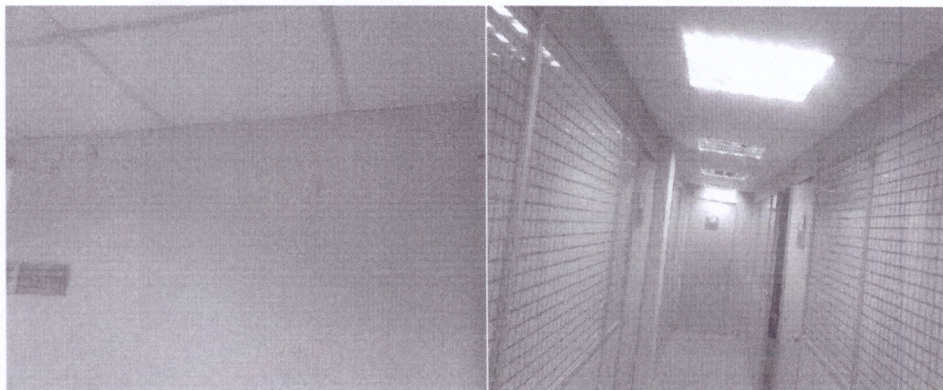
Figura 3 - Inexistência de luzes de emergência

1.5.1 A edificação não apresenta sistema de iluminação de emergência em todos os andares.