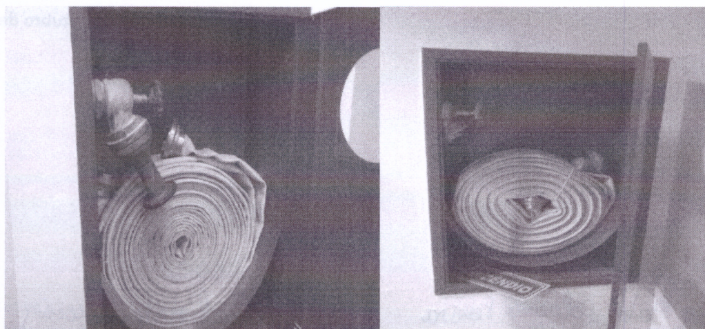
Figura 6 - Sistema de Hidrante

1.7.1 Alguns hidrantes encontram-se sem as válvulas e sem manutenção preventiva comprometendo a utilização do sistema em caso de incêndio.