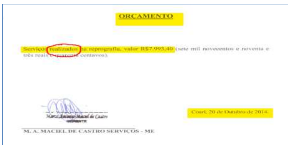
Figura 02 – Recortes do “orçamento” Processo nº 23389.000006/2015-60

Fonte: processos disponibilizados pelo Campus Coari