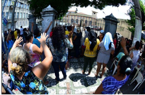
A Cadeia Pública Raimundo Vidal Pessoa foi reativada no último dia 2 para receber presos ligados ao Primeiro Comando da Capital (PCC).

14/01/2017 às 17:56 - Atualizado em 14/01/2017 às 17:59