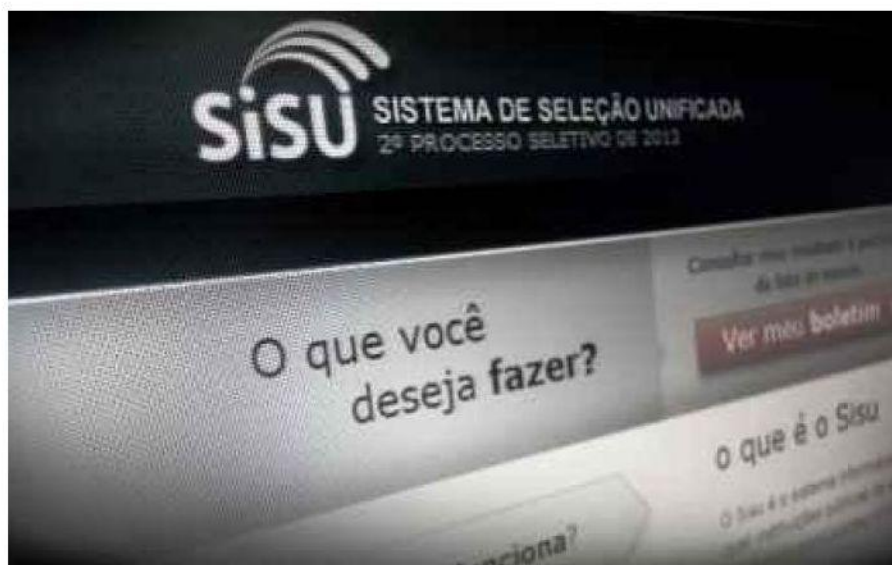
O Sisu é o sistema informatizado gerenciado pelo Ministério da Educação (MEC), que utiliza as notas do Enem.

quinta-feira 19 de janeiro de 2017 - 6:55 PM Girleene Medeiros / portal@d24am.com