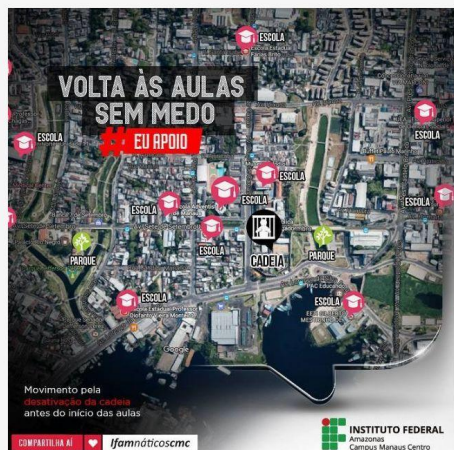
Gráfico feito pelo Ifam com as escolas próximas da Cadeia Pública Raimundo Vidal Pessoa

"A preocupação sempre existiu, mas quando estava funcionando, até outubro, não havia esse indicio de rebelião. [...] Agora com essa grande onda de situações, que é uma questão nacional, não temos o mínimo de conforto e segurança em relação à proximidade ao presídio", acrescentou.