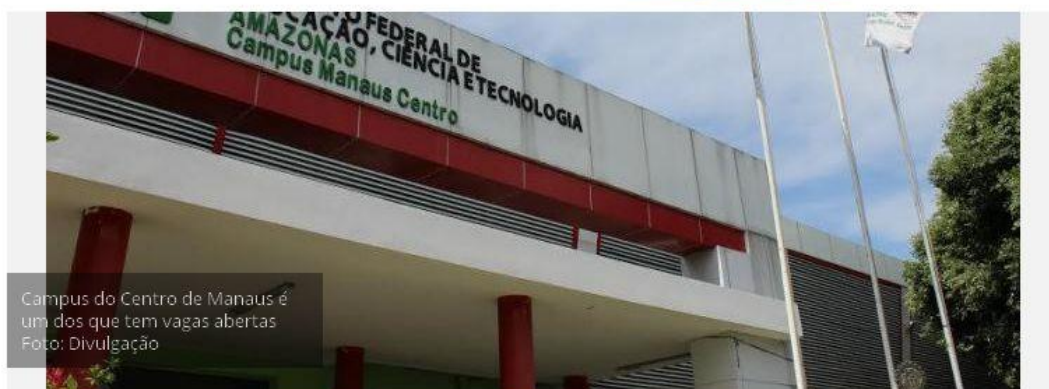
Campus do Centro de Manaus é um dos que tem vagas abertas

Manaus – O Instituto Federal de Educação do Amazonas (Ifam) está com 27 vagas abertas, distribuídas entre servidores e público externo, para o Mestrado Profissional ofertado pelo Programa de Pós-Graduação em Educação Profissional e Tecnológica (ProfEPT).