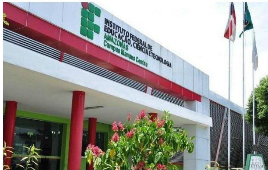
Os interessados têm até o dia 27 de janeiro para se matricular no Campus Manaus Centro.

Com informações de assessoria / portal@d24am.com