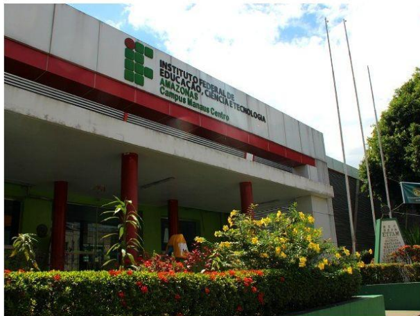
Instituto Federal de Educação, Ciência e Tecnologia do Amazonas (IFAM), situado na Avenida Sete de Setembro, Zona Sul de Manaus

O Instituto Federal do Amazonas (IFAM) está ofertando 378 vagas por meio do Sistema de Seleção Unificada (Sisu) em 17 cursos tecnológicos, licenciaturas e bacharelados. Os cursos são ofertados exclusivamente nos campi Manaus Centro (CMC), Manaus Distrito Industrial (CMD) e Manaus Zona Leste (CMZL).