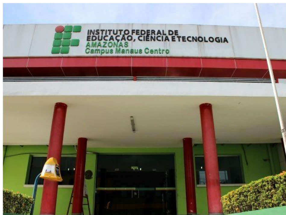
Sede do Ifam Manaus

A partir desta terça-feira (31), estão abertas as inscrições para o processo seletivo dos cursos de graduação do Instituto Federal do Amazonas (IFAM). Ao todo são ofertadas 84 vagas para os cursos de licenciatura em Física e Pedagogia, na modalidade Educação a Distância (EaD), nos polos da Universidade Aberta do Brasil (UAB), localizados em Coari (AM), Lábrea (AM), Tefé (AM), Boa Vista (RR) e Mucajaí (RR). (veja o edital)