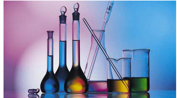
Ilustração 1: xxxxxxxx

XXXXXXXX. X XXXXXXXXXXXX XXXXXXXX XXXXXXXXXXXX XXXXXXXXXXXX XXXXXXXX XXXXXXXX.