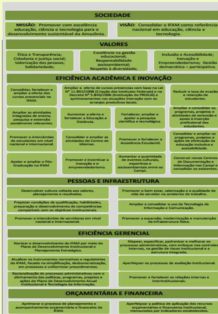
Figura 2. Mapa Estratégico do IFAM.