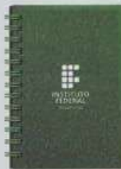
ITEM 06 CADERNO PERSONALIZADO WIRE-O