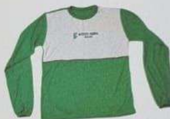
ITEM 27 CAMISA ESCOLAR MANGA LONGA