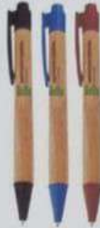
ITEM15 CANETA ESFEROGRÁFICA DE CLICK