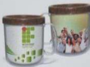
ITEM 23 CANECA ECOLÓGICA DE PLÁSTICO - 300ML