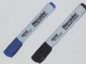
ITEM17 PARES DE PINCÉIS PARA QUADRO BRANCO