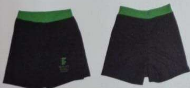
ITEM 30 SHORT SAIA