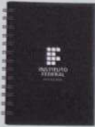
ITEM14 AGENDA ANUAL