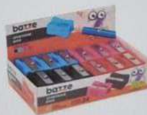
ITEM 08 APONTADOR SEM DEPÓSITO