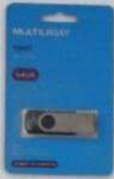
ITEM12 MEMÓRIA PORTÁTIL