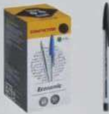
ITEM 01 CANETA ESFEROGRÁFICA PRETA