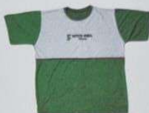
ITEM 25 CAMISA MANGA CURTA