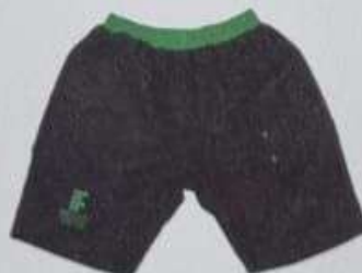
ITEM 29 BERMUDA MASCULINA - TECTEL