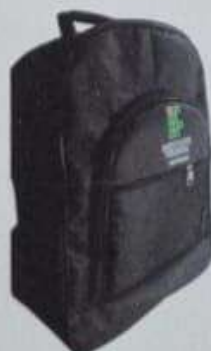
ITEM 10 MOCHILA EM NYLON