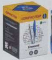
ITEM 02 CANETA ESFEROGRÁFICA AZUL