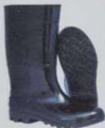
ITEM 24 BOTA DE BORRACHA