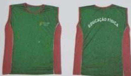
ITEM 26 CAMISETA PARA ED. FÍSICA