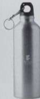
ITEM19 GARRARA SQUEEZE - ALUMÍNIO