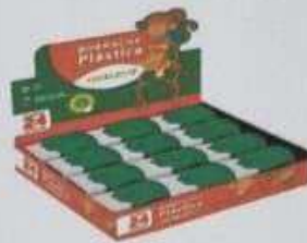
ITEM 04 BORRACHA BRANCA SUAVE E ATÓXICA