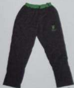
ITEM 28 CALÇA UNISSEX UNIFORME - TECTEL