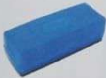
ITEM16 APAGADOR DE QUADRO BRANCO