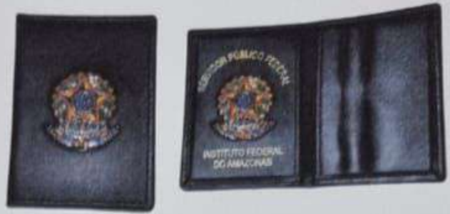
ITEM13 CARTEIR EM COURO COM BRASÃO