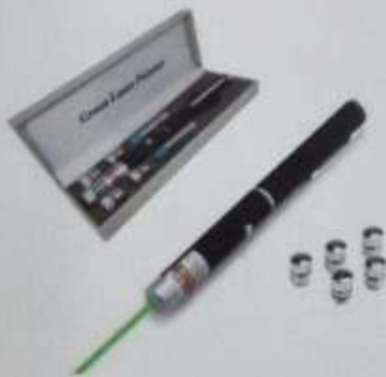
ITEM18 CANETA LASER POINT