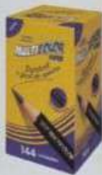
ITEM 03 LÁPIS EM GRAFITE