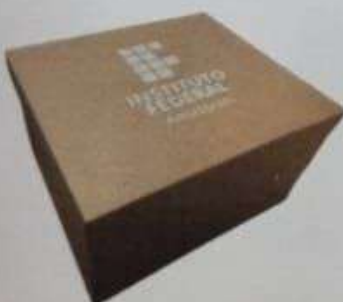
ITEM20 CAIXA PARA EMBALAGEM