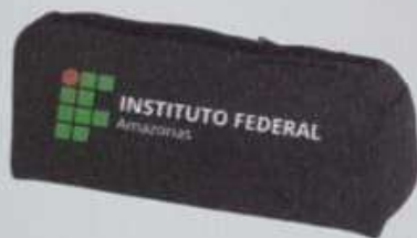
ITEM 05 ESTOJO ESCOLAR