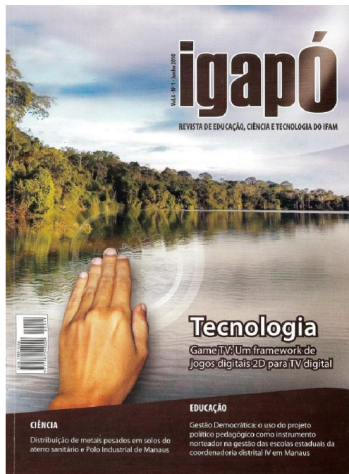
Figura 1: Capa da Revista Igapó

É importante o autor saber que a Revista Igapó é impressa e o tamanho mínimo de qualquer imagem, gráfico, fotografia ou ilustração deve ser de, no mínimo, 225 dpi. O artigo será devolvido para o autor se, na prova final da gráfica, as imagens apresentarem defeito na impressão devido a baixa resolução, pois tal ato compromete a qualidade da publicação. Abaixo, exemplo de uma imagem com resolução em 300 dpi.