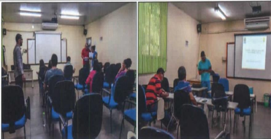
Figura 03. Defesas finais de PIBIC, Ciclo 2017-2018.