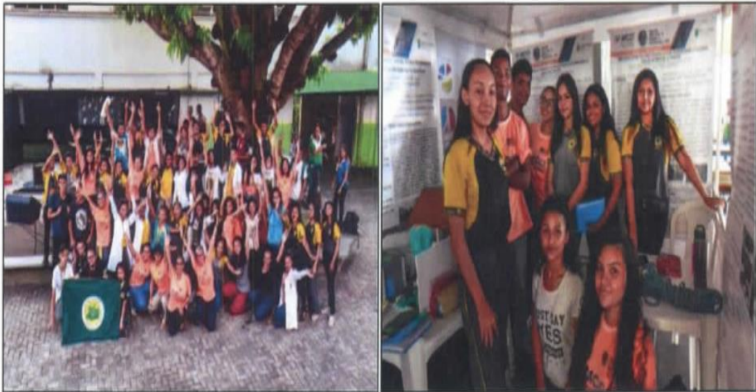
Figura 19. Alunos das Escolas Públicas de Manaus expondo trabalhos na IV Mostra Científica e Cultural do CMC.