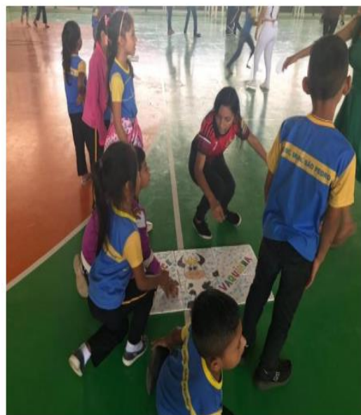
Fig – Atividade lúdica educativa – AgroAção.