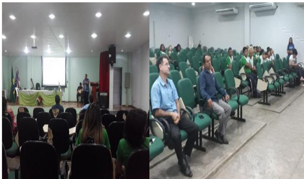
Palestra: Ensino Médio Integrado-política pública para a redução da desigualdade social.