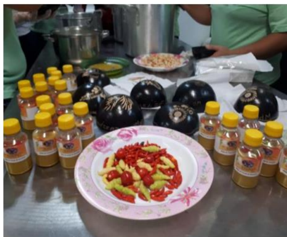
Fig – Boas Práticas de Manipulação de Alimentos.