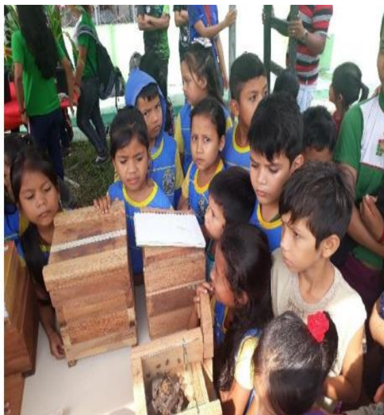
Fig - Exposição: A vida secreta das abelhas.