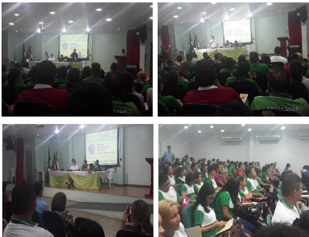
Fig 1 – Solenidade de abertura