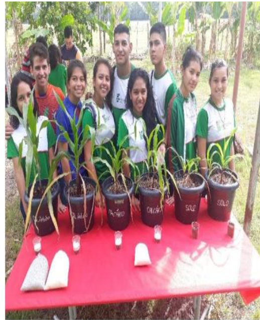
Fig - Oficina: Como adubar?