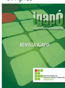
Figura N – Título da figura - formatado em Myriad 10 , centralizado, 0pt antes, 0pt depois, espaçamento simples

- formatado em Myriad 10 , centralizado