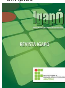
Figura N – Título da figura - formatado em Myriad 10 , centralizado, 0pt antes, 0pt depois, espaçamento simples

Fonte: Fulano (ano) - formatado em Myriad 10 , centralizado