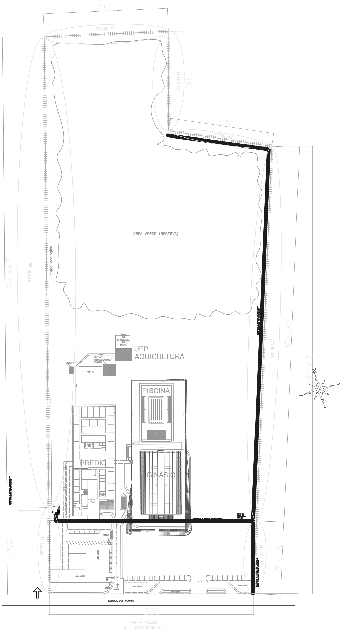
IMPLANTAÇÃO DOS SETORES E CANTEIRO DE OBRAS DO MURO DE MAUÉS ESCALA 1:1250