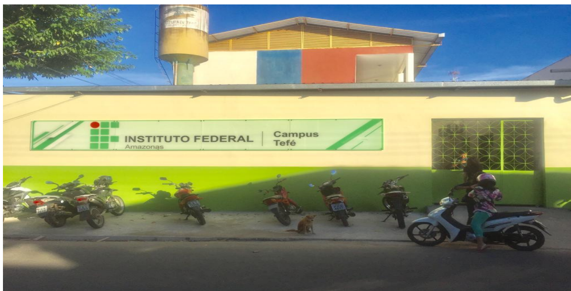
Figura 16 – Vista da entrada da sede provisória do campus Tefé