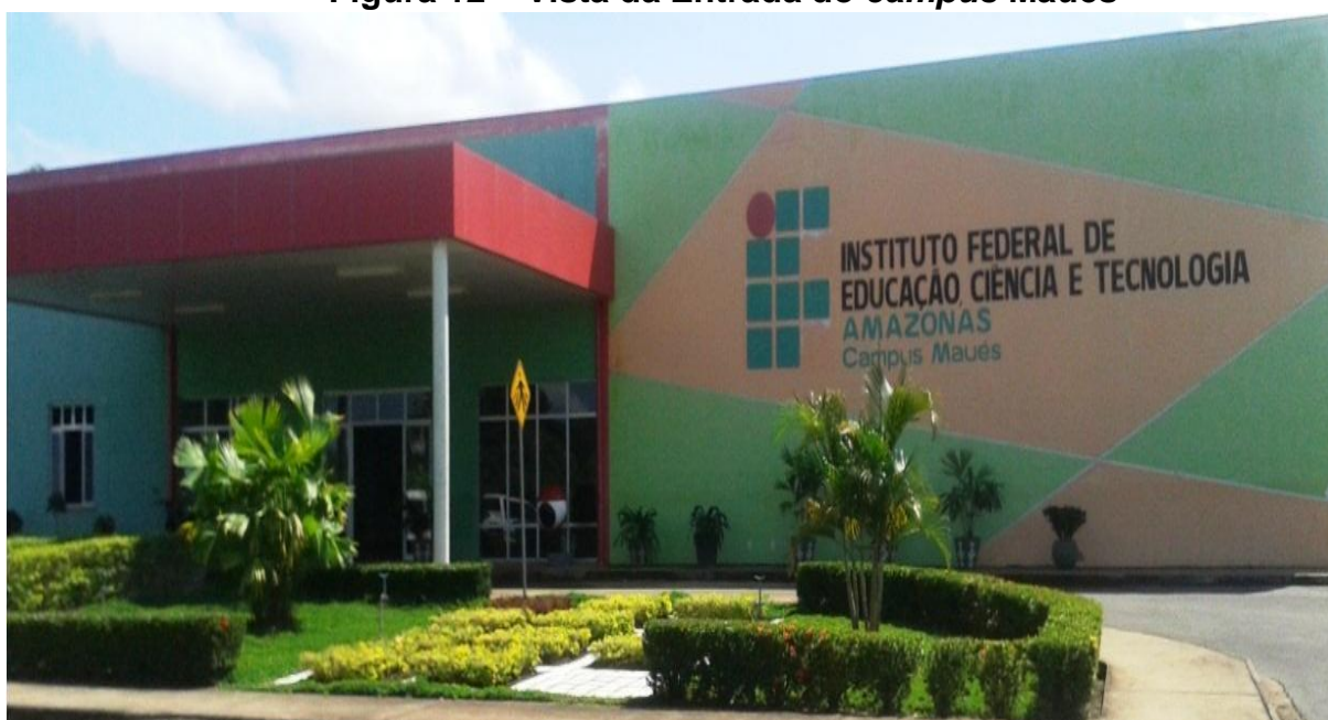
Figura 12 – Vista da Entrada do campus Maués

O município de Maués pertencente à mesorregião do centro amazonense é conhecido como a “Terra do Guaraná” e foi um dos cinco municípios do Amazonas, contemplados, na Fase II de Expansão da Rede Federal de Educação, com um campus do IFAM. Assim, a construção do prédio do novo campus iniciou em janeiro de 2009 e foi concluída em junho de 2010.