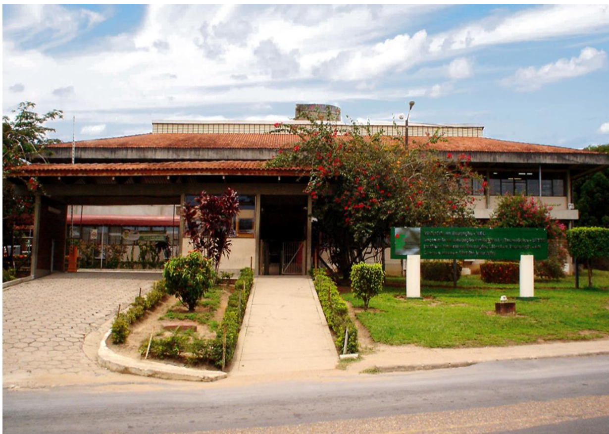
Figura 7 - Vista da Entrada Principal do campus Manaus Distrito Industrial

Pela Portaria Ministerial Nº 04, de 06 de janeiro de 2009, que estabelece a relação dos campi que passaram a compor cada um dos Institutos Federais, criados em 2008; a UNED tornou-se campus do IFAM e passou a denominar-se campus Manaus Distrito Industrial (CMDI) (Figura 7).