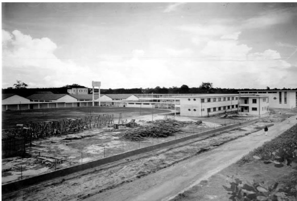
Figura 3 - Vista área da construção da Escola Técnica Federal de Manaus em 1941, na antiga Praça Rio Branco

E como Escola Técnica Federal do Amazonas – ETFAM em 1959, tornou-se autarquia e passou a ganhar autonomia didática e de gestão, recebendo nas últimas décadas do século XX, a sigla ETFAM, sinônimo de qualidade do ensino profissional para todo o estado do Amazonas. Nessa condição, ofertou cursos voltados para a formação de trabalhadores (as) para o atendimento às necessidades demandadas pela Zona Franca de Manaus, como técnicos em: eletrônica, mecânica, química e edificações, dentre outros.