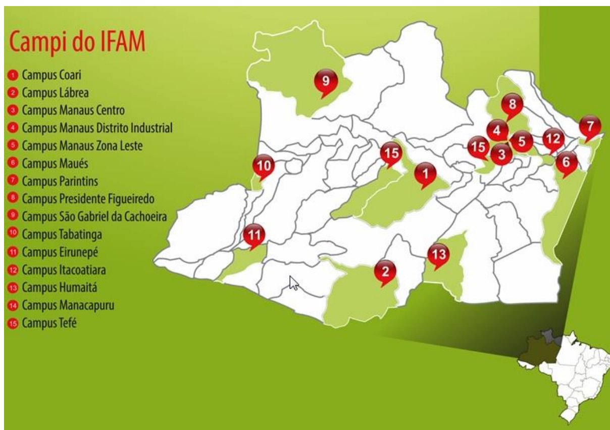
Figura 1 - Mapeamento dos campi do IFAM

O Processo de expansão da Rede Federal de Educação, possibilitou ao IFAM fazer-se presente em todas as mesorregiões do Estado do Amazonas (Figura 1), totalizando hoje, quatorze campi assim nominados: campus Manaus Centro, campus Manaus Zona Leste, campus Distrito Industrial, campus Coari, campus Eirunepé, campus Humaitá, campus Itacoatiara, campus Lábrea, campus Maués, campus Parintins, campus Presidente Figueiredo, campus São Gabriel da Cachoeira, campus Tabatinga e campus Tefé, além de um campus Avançado de Manacapuru e um Centro de Referência no município de Iranduba.