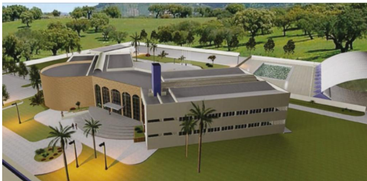
Figura 17 – Projeto arquitetônico do campus Tefé