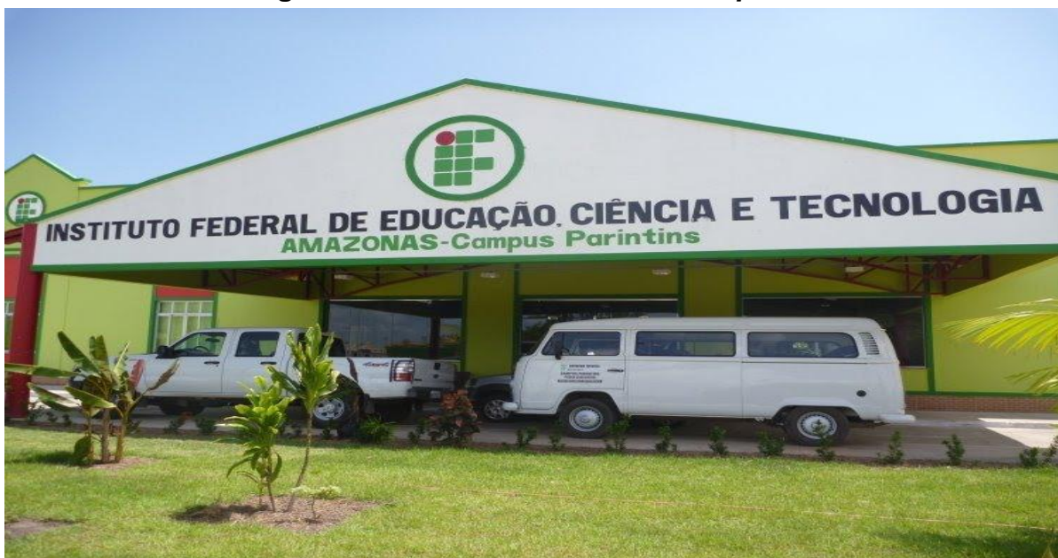
Figura 13 – Vista da entrada do campus Parintins