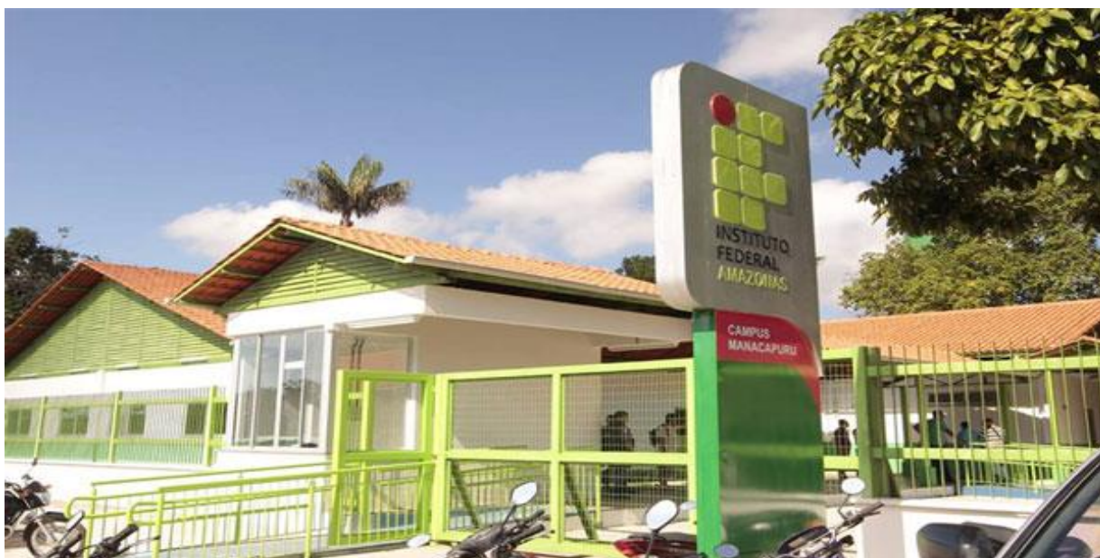
Figura 21 – Vista da entrada do campus Avançado de Manacapuru