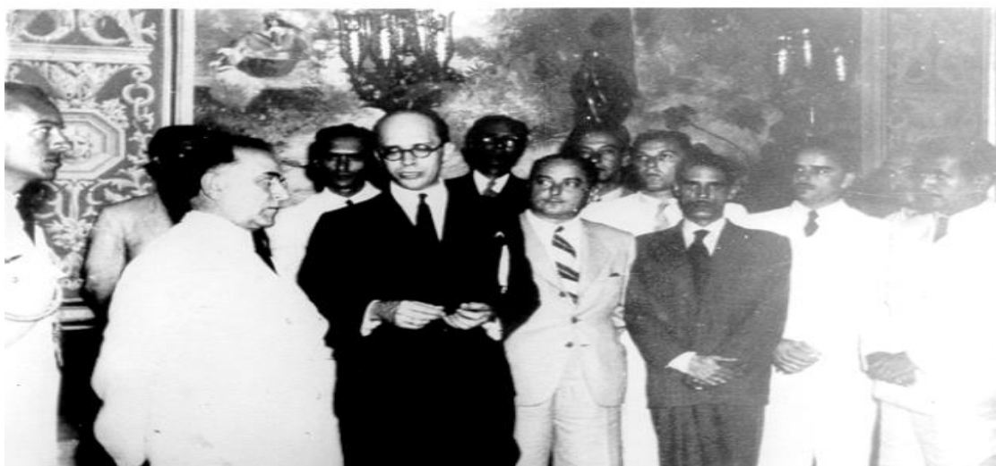
Figura 2 - Solenidade de inauguração do Liceu Industrial de Manaus em 1941, no Teatro Amazonas

Foi somente, em 1941, após ter como sede uma chácara, um Mercado Municipal e mesmo uma Casa de Detenção, já como Liceu Industrial de Manaus, que em 10 de novembro, no Teatro Amazonas, foi realizada a solenidade de inauguração do Liceu Industrial de Manaus, com instalações definitivas, situada na Avenida Sete de Setembro, cuja construção estava edificada numa estrutura física proposta pelo Governo Federal no conjunto da reforma educacional do Estado. A inauguração do Liceu Industrial de Manaus contou com a presença do Presidente da República Getúlio Vargas e do Ministro da Educação e Cultura, Gustavo Capanema (Figura 2).