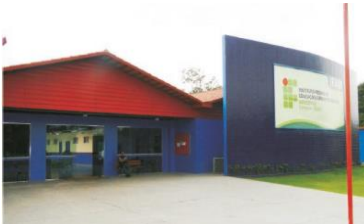
Figura 10 - Vista da entrada do campus Coari