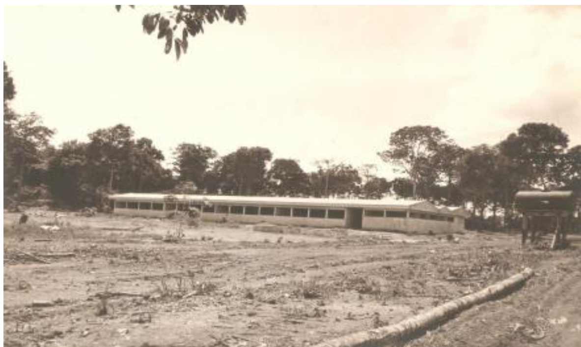
Figura 5 - Construção do Colégio Agrícola, endereço atual – 1970

Em Manaus, o Aprendizado Agrícola foi instalado em 19 de abril de 1941, no local chamado Paredão, hoje atual Estação Naval Rio Negro. Denominado Ginásio Agrícola do Amazonas, pelo Decreto Lei Nº 53.558, de 13 de fevereiro de 1964. No ano de 1972 é elevado à categoria de Colégio, passando a denominar-se Colégio Agrícola do Amazonas (Figura 5). No mesmo ano, o Colégio Agrícola foi transferido para suas atuais instalações na Avenida Cosme Ferreira, Bairro São José Operário, na Zona Leste da cidade.