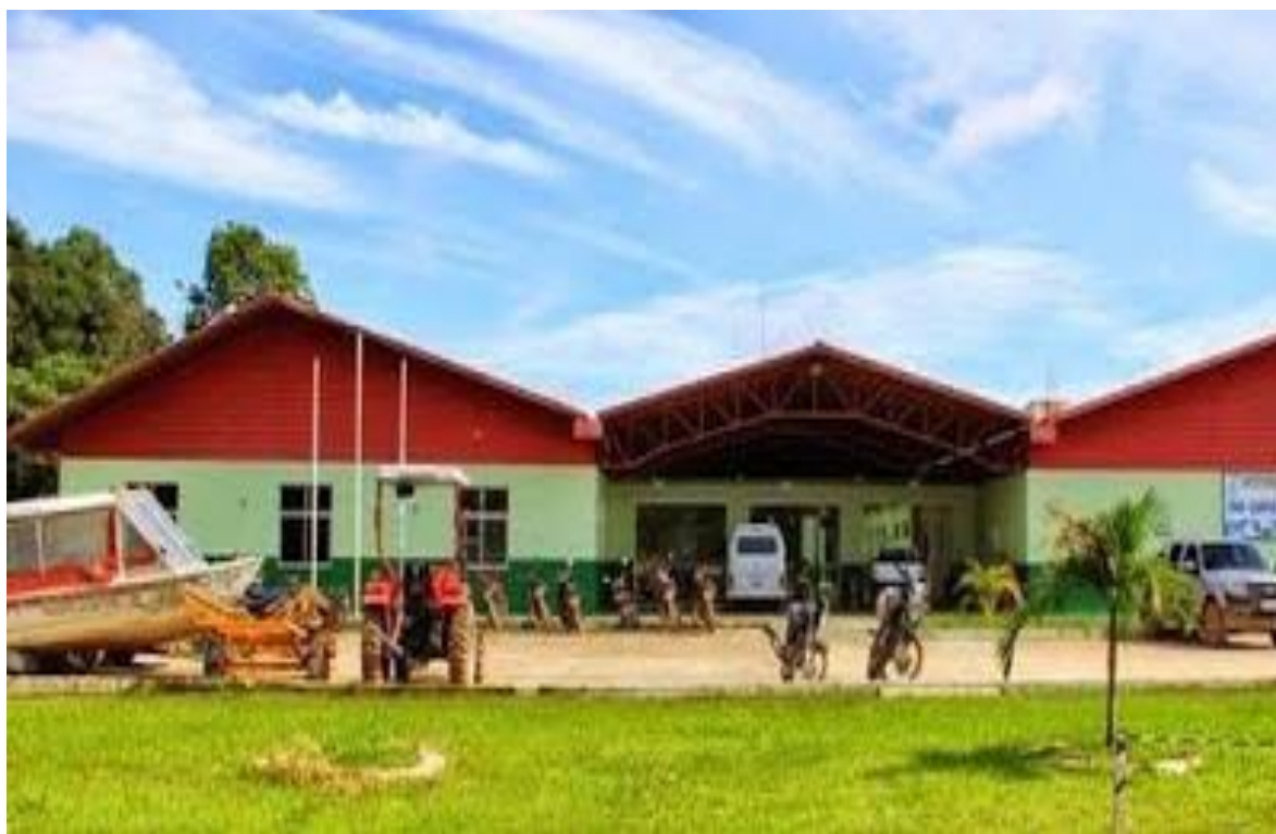
Figura 15 – Vista da Entrada do campus Tabatinga

Tabatinga foi contemplado com a criação de um campus do IFAM, em 2010, quando o campus iniciou suas atividades no município, onde teve posteriormente sua inauguração; trazendo consigo uma referência de qualidade na oferta de Educação Profissional da Região do Alto Solimões.