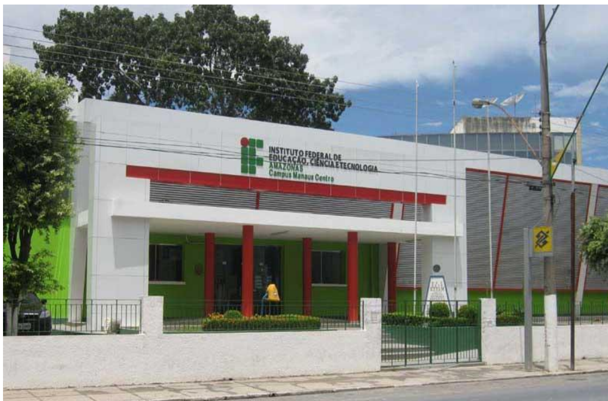
Figura 4 - Fachada principal do campus Manaus Centro

Em face da Lei Nº 11. 892, no dia de 29 de dezembro de 2008, o Centro Federal de Educação Tecnológica do Amazonas tornou-se campus do Instituto Federal de Educação, Ciência e Tecnologia do Estado do Amazonas – IFAM e passou a denominar-se Instituto Federal de Educação, Ciência e Tecnologia do Amazonas – IFAM, campus Manaus Centro (Figura 4).