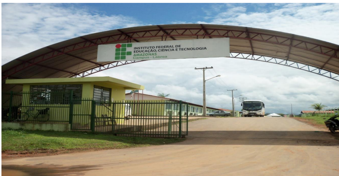
Figura 11 – Vista da entrada do campus Lábrea

O campus Lábrea foi inaugurado no dia 1º de fevereiro de 2010 e suas atividades acadêmicas tiveram início no dia 7 de março daquele ano.