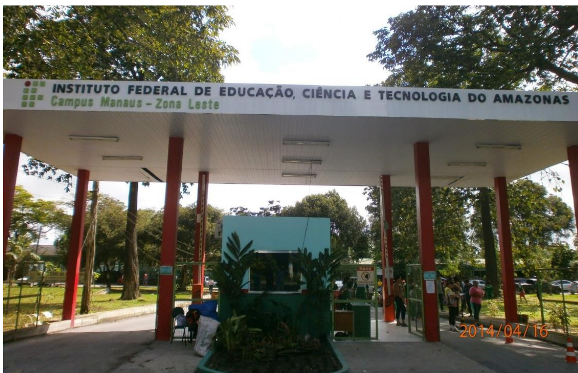
Figura 6 - Vista da Entrada do campus Manaus Zona Leste

Em face da Lei Nº 11. 892, no dia de 29 de dezembro de 2008, a Escola Agrotécnica Federal de Manaus tornou-se campus do Instituto Federal de Educação, Ciência e Tecnologia do Estado do Amazonas – IFAM e passou a denominar-se Instituto Federal de Educação, Ciência e Tecnologia do Amazonas – IFAM, campus Manaus Zona Leste (Figura 6).