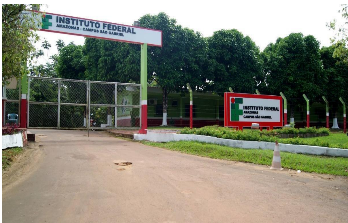
Figura 9 - Vista da entrada do campus São Gabriel da Cachoeira

Com o ato de criação do IFAM, a Escola Agrotécnica de São Gabriel da Cachoeira se tornou o campus São Gabriel da Cachoeira – CSGC, sendo juntamente com o CMC e o CMZL os campi que constituíram, originalmente o IFAM. No espaço em que atua, o CSGC busca na identificação e no reconhecimento das potencialidades da região a criação de alternativas econômicas sustentáveis, baseadas no diálogo entre os conhecimentos tradicionais indígenas e os métodos científicos ocidentais, visando produzir referências técnicas que ajudem na melhoria das condições de vida das populações do noroeste do Amazonas, prioritariamente os povos indígenas.