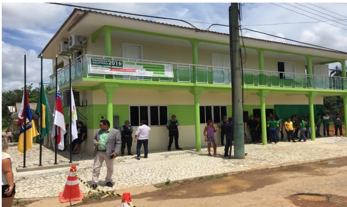
Figura 18 – Vista do prédio da sede provisória do campus Eirunepé