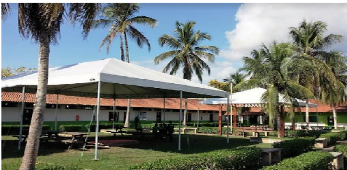
Figura 20 – Vista da entrada do campus Humaitá