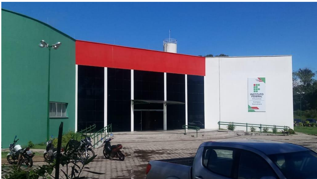
Figura 19 – Vista da entrada do campus Itacoatiara