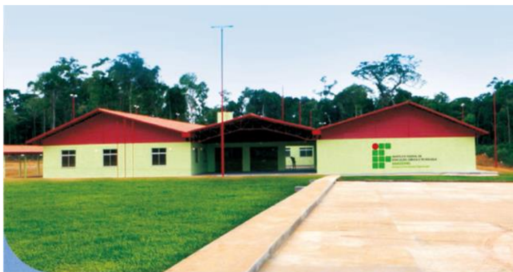
Figura 14 – Vista da entrada do campus Presidente Figueiredo